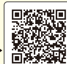
さっぽろしきこうへんどうたいさくどうこうけいかく 札幌市気候変動対策行動計画

あんだんか 温暖化による影響を抑えるために札幌市は2050年までに にさんかたんそ はいしゅつりょう 二酸化炭素排出量実質ゼロを目指してゼロカーボンシティを宣言し、 とりくみ 取組を進めています。