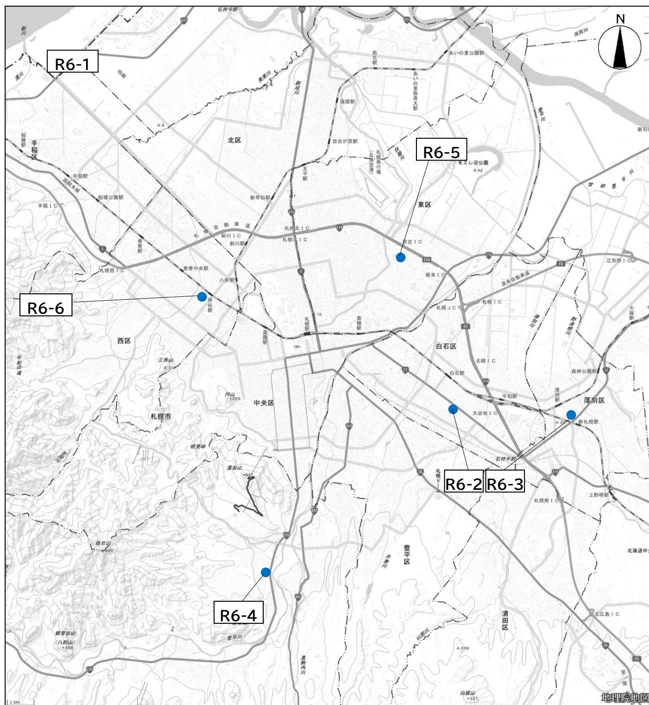
図 4-2-1 令和6年度 一般環境騒音調査地点