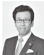
札幌市 市長 秋元 克広

上智大学法学部卒業後、環境庁(現環境省)へ入庁、ドイツ留学、資源エネルギー庁への出向、リサイクル推進室室長補佐、地球温暖化対策課課長補佐等を経て、2016年より現職。