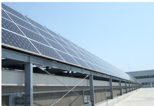
センターヤード・ トップライトに設置