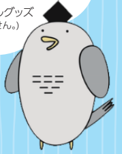
札幌市の生物多様性 PRキャラクター 「カッコー先生」

※円山動物園、サンピアザ水族館などのオリジナルグッズ (賞品は変更になる場合があります。賞品の選択はできません。)