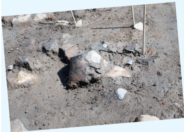
C449遺跡 (中央区北6条西15丁目) 続縄文文化 (約1千6百年前)