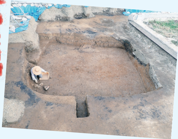
N434遺跡 (西区八軒9条東5丁目) 擦文文化 (約1千年前) 縄文文化晩期 (約2千3百年前)