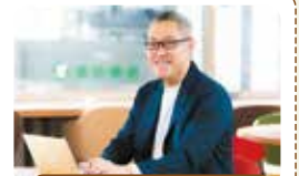
研修講師プロフィール

介護事業経営のコンサルタント。 経営者・理事長の経営参謀として、 業務効率化から利用者・入居者獲得まで、 様々な経営のコンサルを行っています。