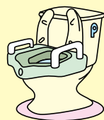
自動排泄処理装置の交換可能部品