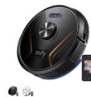
Eufy RoboVac X8 Hybrid カラー：ブラック、ホワイト