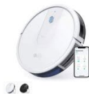
Eufy RoboVac 15C カラー：ホワイト、ブラック

https://www.anker-japan.com/pages/robovac-support