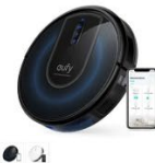
Eufy RoboVac G30 カラー：ホワイト、ブラック