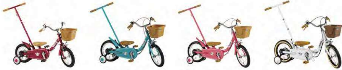
12 インチ スカーレット 14 インチ ブルーミングターコイズ / ブルーミングラズベリー 14 インチプレミアムホワイト