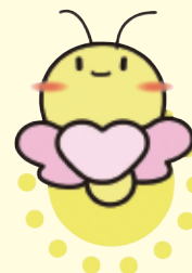
札幌市地域包括支援センター イメージキャラクター 「ほっター」