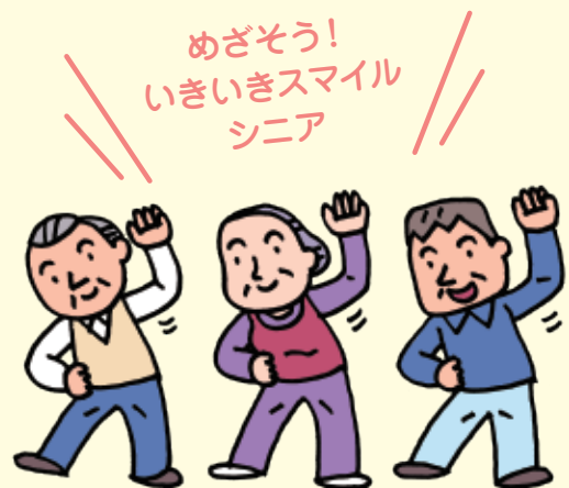
サッポロスマイル体操