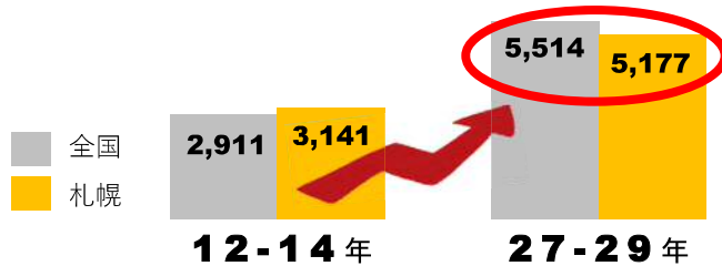
第1号被保険者保険料基準額の推移 (単位：円)