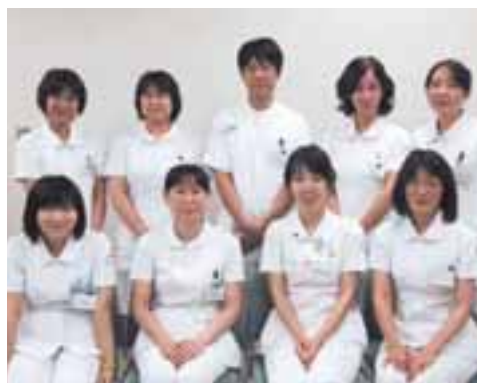
CN看護実践サポート委員会メンバー

なお、本セミナーは看護職員・医療従事者を対象としております。参加ご希望の方は同封の申し込み用紙に必要事項を記載の上、FAXでお申し込みください。（無料です）