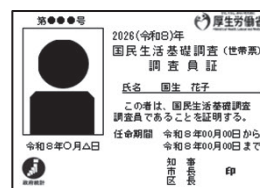
調査員が 身につけている 『調査員証』（見本）