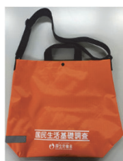
調査員が持ち歩く 手さげ袋（見本）