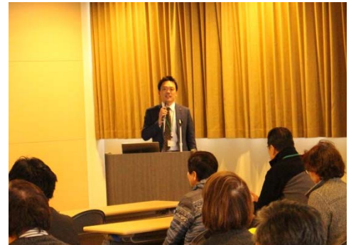
パイオニアジャングループの9次産業化に関するお話はとても興味深く参加者の皆さんも真剣に話を聞いていました。