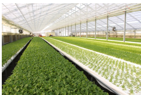
ハウスは22m×105m（700坪）ととても広く、1年を通じてベビーリーフの水耕栽培を行っています。