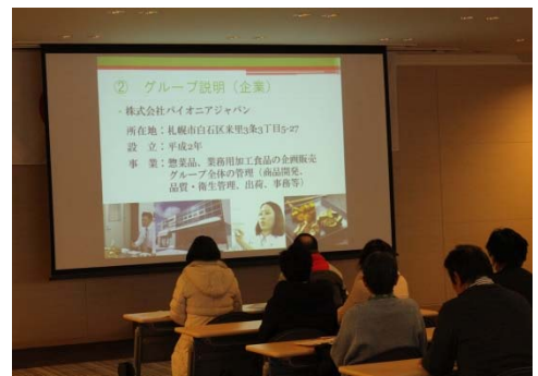
生産、収穫、選別、加工、製造、販売までの流れについて、しっかり学ぶことができました。