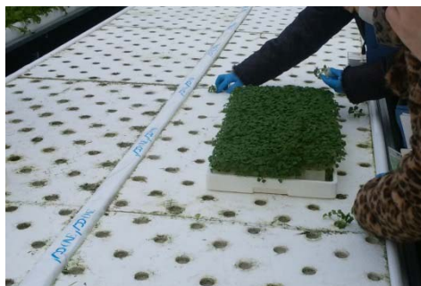
やま道の里の方のご好意で、ベビーリーフの苗植えを体験させていただきました。