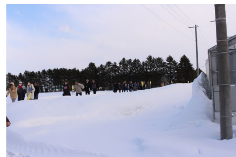
やま道の里に到着後、バスの降車場所から見学先の大型ハウスまで移動しました。積雪期以外にはハウス周辺でも土耕栽培を行っています。