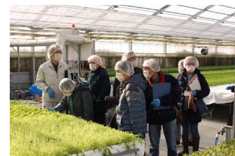
参加者からの質問に丁寧に答えいただきました。多くの方が、熱心に質問されていました。