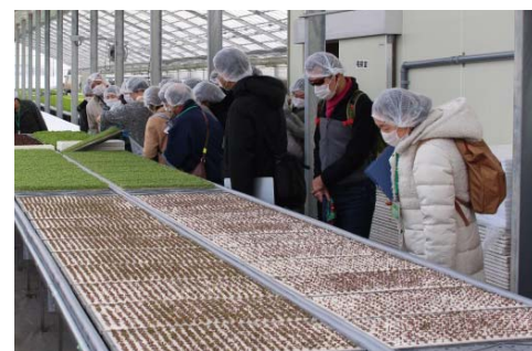
ベビーリーフの種植えから出荷までの流れについて説明していただきました。