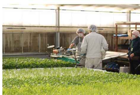
収穫機でベビーリーフの収穫の様子をデモンストレーションしていただきました。