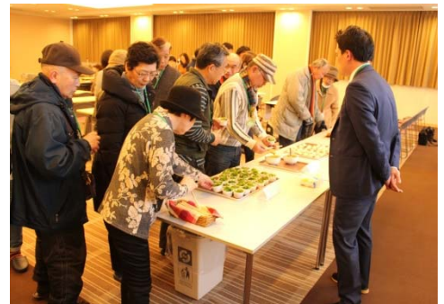
先ほど見学したベビーリーフの他、ポテトサラダとメンチカツを試食させていただきました。どれも美味しく、皆さん満足されていました。