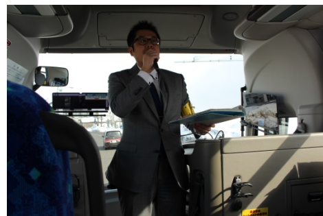
受付後、バスに乗り込み、札幌市役所を出発！ 出発後にバス内でオリエンテーションを行いました。

初めに担当の方から、ハウスで生産しているベビーリーフについて、生産から収穫まで順を追って説明いただきました。続いて、実際にベビーリーフの苗を植える体験、収穫機で収穫の様子をデモンストレーションしていただくなど、工夫を凝らした見学内容で、丁寧に説明していただきました。