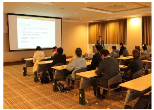
後半は、パイオニアジャパン米里工場で同社の食の安全・安心に関する取組等を説明していただきました。