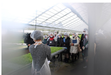
ハウスの中はとても暖かく、外気との温度差でカメラのレンズが曇ってしまうほどでした。