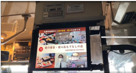
バス車内動画広告の様子

ポストコロナ時代を見据え、集客型イベントによらずに幅広い世代に食の安全に関する情報を届けることを目的として、札幌市公式ホームページや広報さっぽろはもちろん、動画広告やSNSなど、さまざまな媒体を活用した情報発信を行っています。