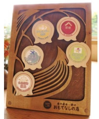
オリジナル啓発ボード

平成27年度（2015年度）より登録を開始し、令和4年度末までの登録数は167店舗（累計）です。