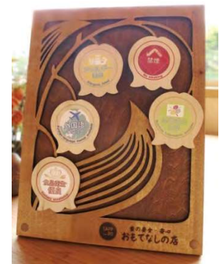
オリジナル啓発ボード

平成27年度（2015年度）より登録を開始し、令和3年度末までの登録数は162店舗（累計）です。