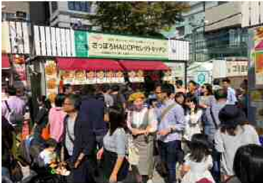
昨年度の実施状況