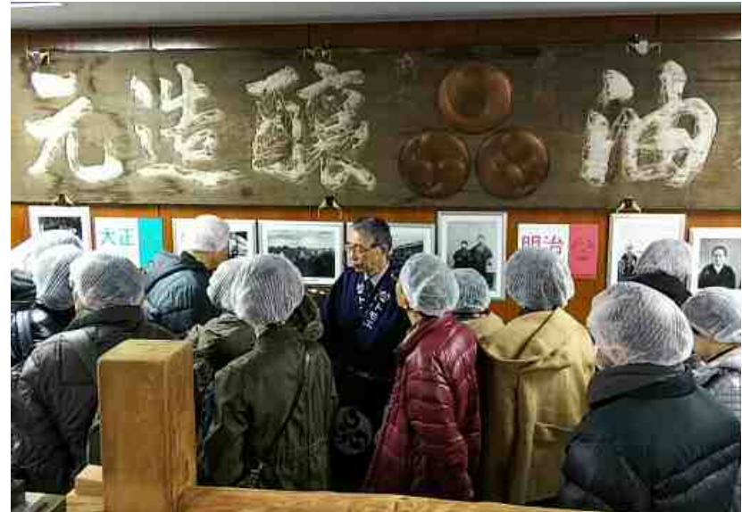
昨年度の実施状況

生産・製造現場の見学、 事業者との意見交換を通じて、 相互理解と信頼関係の構築を図る。