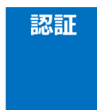
認証制度 (第三者機関)