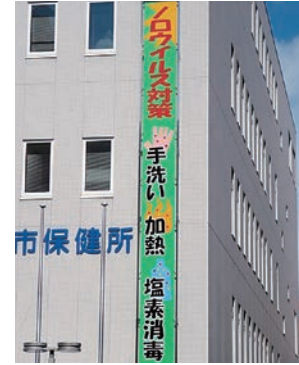
ノロウイルス対策懸垂幕