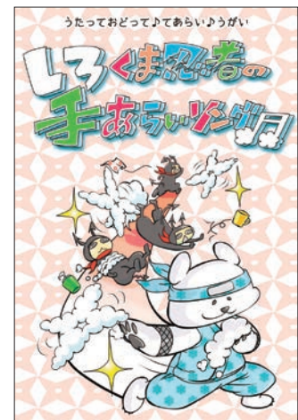
しろくま忍者の手あらいソング