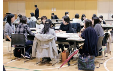
健康危機管理シミュレーション訓練