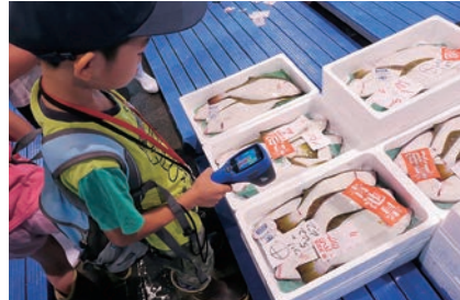
子ども食品Gメン体験事業