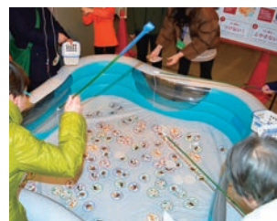
食のまち・さっぽろフェスト inチ・カ・ホ

また、「食の安全・安心」をテーマとしたイベントや意見交換会を開催するほか、地産地消の推進、表示の普及啓発を実施し、市民と事業者が相互に理解を深め、信頼関係を築くことで、リスクコミュニケーションの推進を図ります。