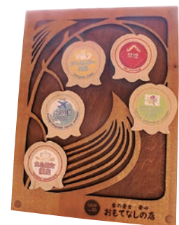
食の安全・安心 おもてなしの店