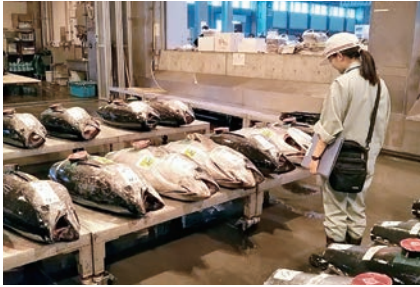
札幌市中央卸売市場の早朝監視

また、食中毒防止対策のほか、食品表示対策、大通公園等で開催される大規模イベント等についても監視指導を強化します。