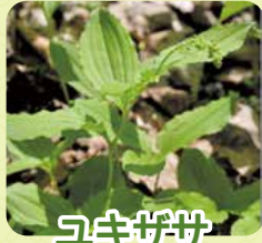
ユキガサ (アズキナ)