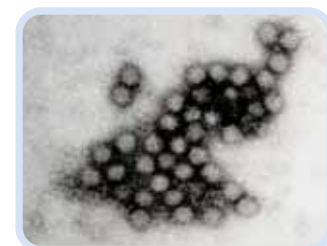
ノロウイルス電子顕微鏡写真