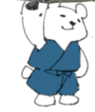
札幌市保健所 手洗いうがい推進 キャラクター しろくま忍者くん