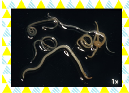
アニサキス。くるくる丸まっている。

魚介類はやっぱり生がすき! という方も多いのではないのでしょうか。近年、流通手段の発達により生の魚が食卓に並ぶ機会が増えていますが、それと同時に魚にもともとついている寄生虫による食中毒も増加の傾向にあります。