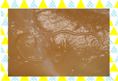
魚の身の中に入りこんだアニサキス。透明に近くわかりづらい。

主に天然魚(サバ、サンマ、イカ、イワシ、ニシン、ホッケ、タラなど)の内臓表面にうずまき状になって寄生しますが、筋肉にも存在することもあります。(ちなみに養殖魚にアニサキスが寄生していることはほとんどありません。)