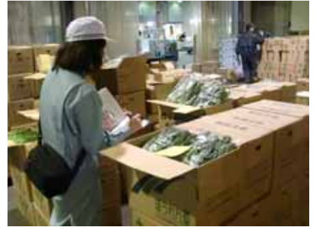
中央卸売市場における監視

詳しくは、厚生労働省のホームページへ ( http://www.mhlw.go.jp/shinsai_jouhou/shokuhin.html )