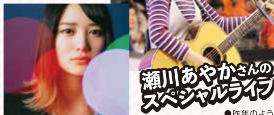
瀬川あやかさんの スペシャルライブ ●昨年ようす

土曜日は札幌出身のシンガーソングライター 葉寧(しおね)が! 日曜日はキャンペーンアンバサダーの瀬川あやかがステージでトーク&ライブ!!