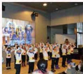
しろくま忍者の手洗い・うがいソングステージ