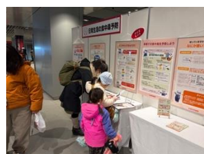
クイズのヒントパネル