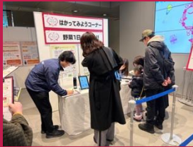
はかってみようコーナー