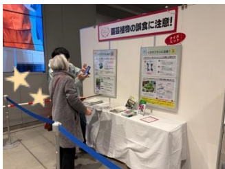
クイズの回答をする方

各コーナーの参加者・閲覧者の向上、また、アンケートの回収率の向上を目的として、スタンプラリー（用紙配布）とスタンプの数に応じた抽選会を実施しました。