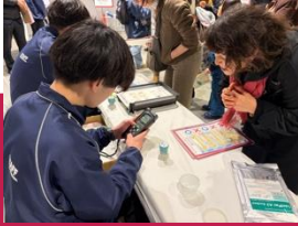
手の汚れチェック

『手の汚れが丸見えに！あなたの手洗いをチェックしよう』、『キッチンの「うっかり」を探そう！〇×ゲーム』 『生焼けに注意！安全に焼肉を楽しもう』、『輪投げ』、野菜の摂取量を測定する『はかってみようコーナー』