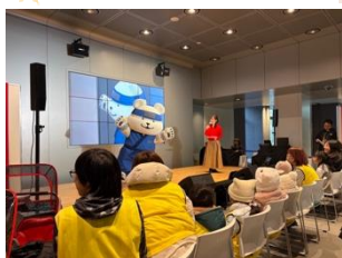
しろくま忍者のクイズ大会 &手洗ソングステージ