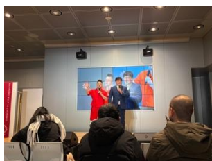
やすと横澤さんトークLIVE