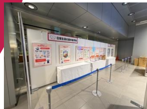
食中毒予防啓蒙パネル