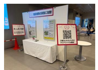
園芸植物の誤食啓蒙パネル