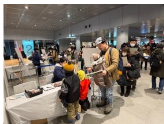
答え合わせの様子