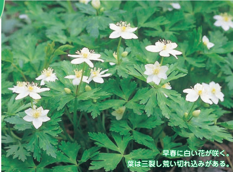
早春に白い花が咲く。 葉は三裂し荒い切れ込みがある。