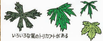
いろいろな葉のトリカブトがある