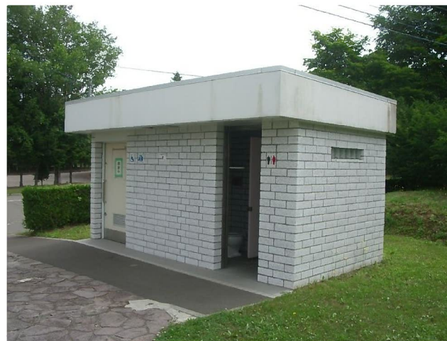
管理事務所前から見たトイレ