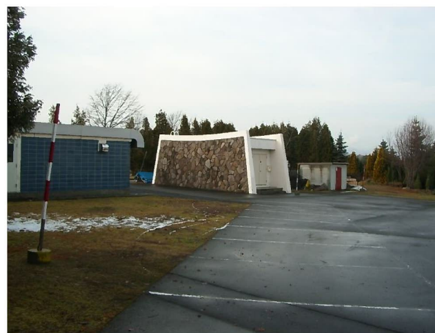
管理事務所裏側の進入路方向の様子