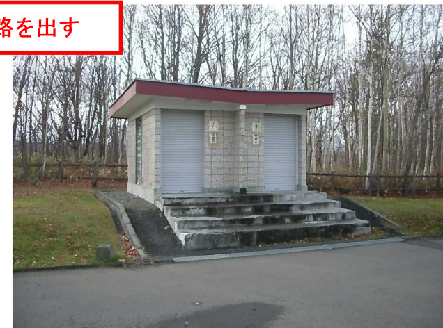
開放する5期3号のトイレ