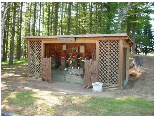
無縁供養塔左側 六地藏堂