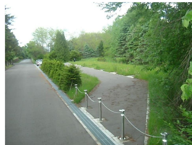
供養塚出入口（奥側）