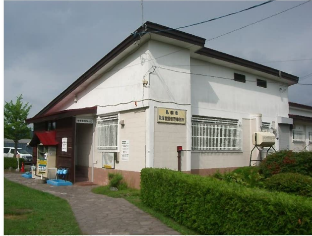
トイレ横からの管理事務所の様子