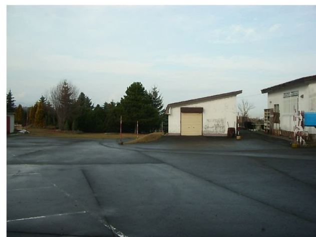
管理事務所裏側の進入路方向の様子