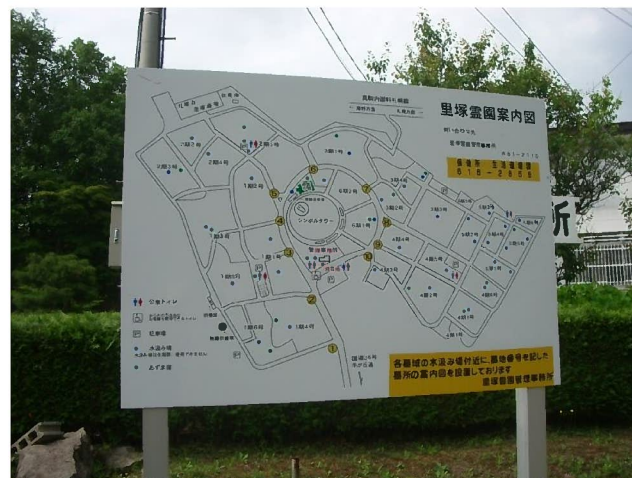
管理事務所前の霊園全体図 看板 【1期4号北西角にも設置しています】