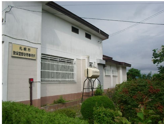
市道側に面した管理事務所の様子