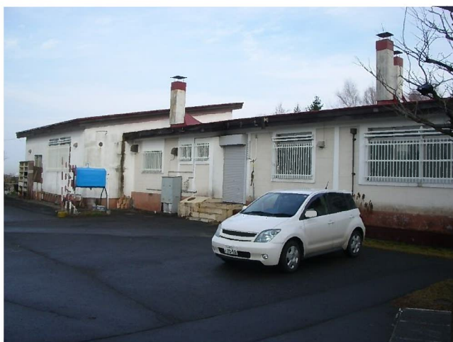
管理事務所裏側の様子