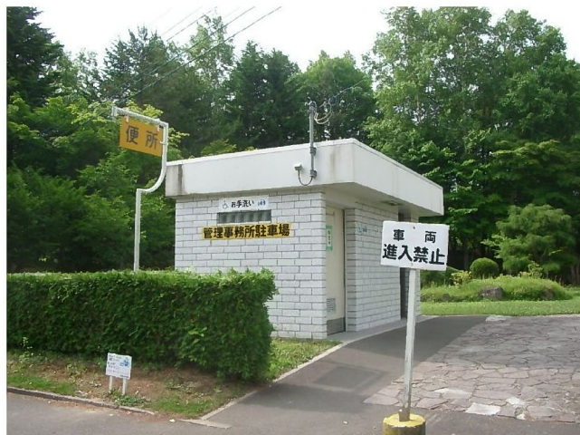
市道側から見た管理事務所前トイレ