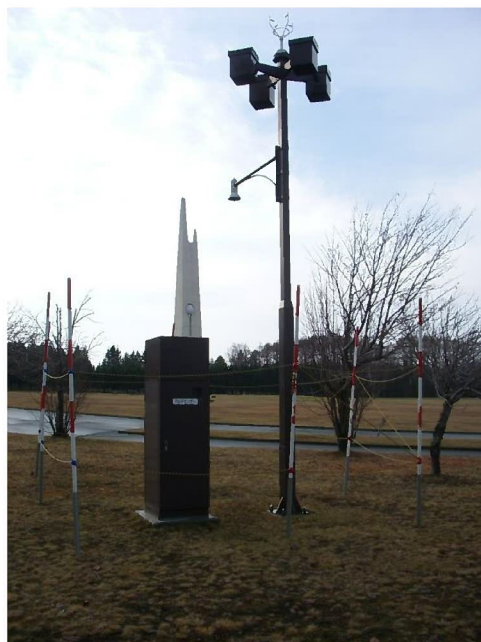
管理事務所裏側奥の気象観測機器