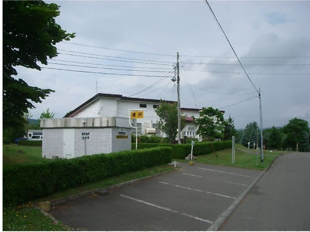
霊園の碑前からの管理事務所の様子