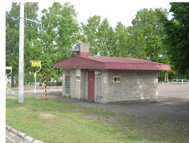
管理事務所向い側 駐車場トイレ 【このトイレは開放しない】