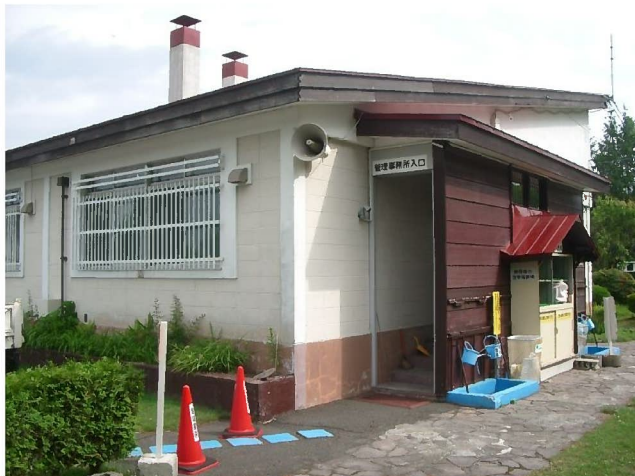
裏側から見た管理事務所入口