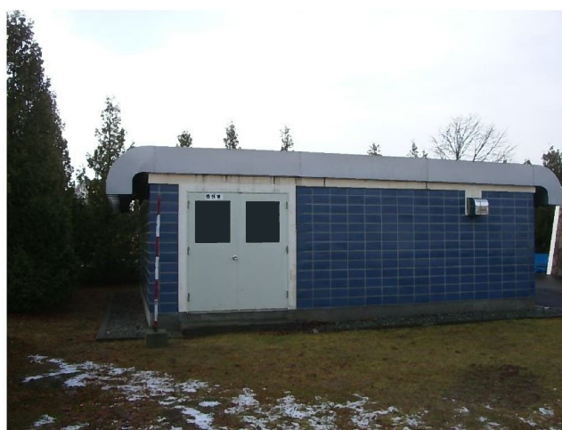
管理事務所裏側機械室