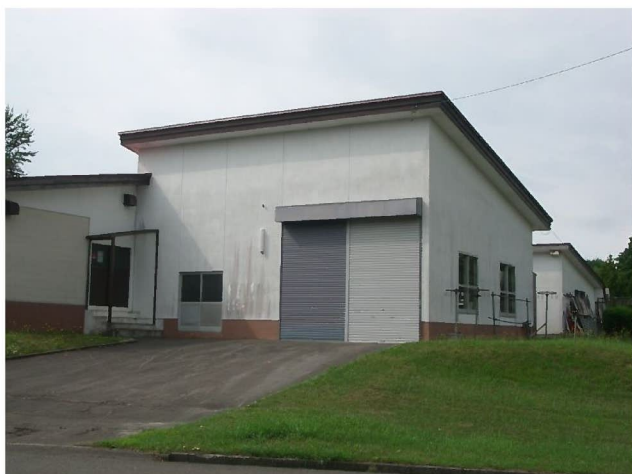
裏口併設の車庫兼倉庫