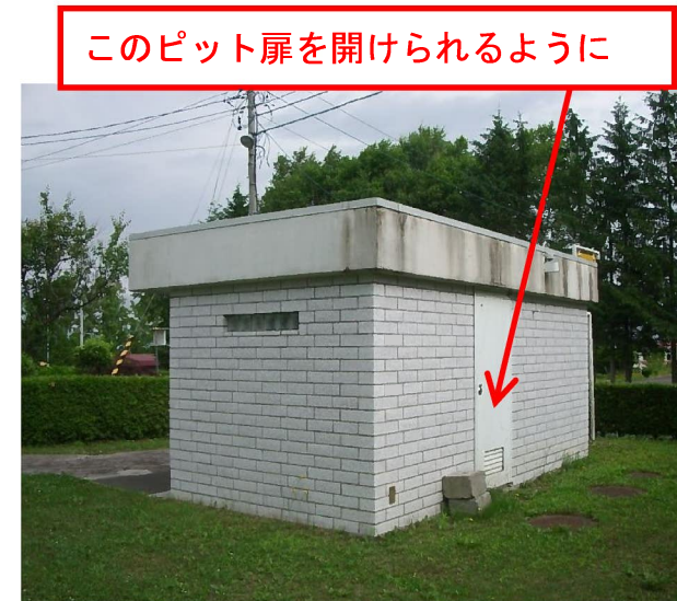
トイレ裏側の様子