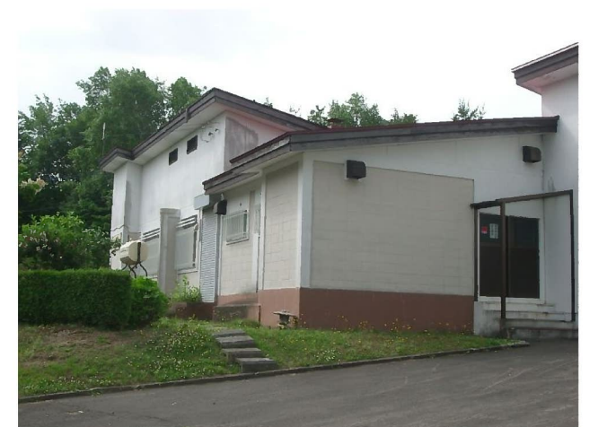
市道側に面した管理事務所裏口側