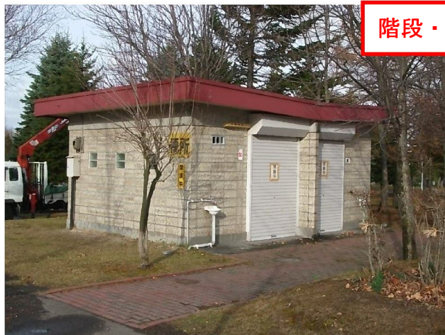
開放する4期5号のトイレ