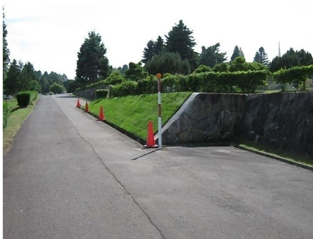
1期6号の道幅が狭くなっている園路の様子