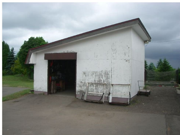
管理事務所裏側倉庫