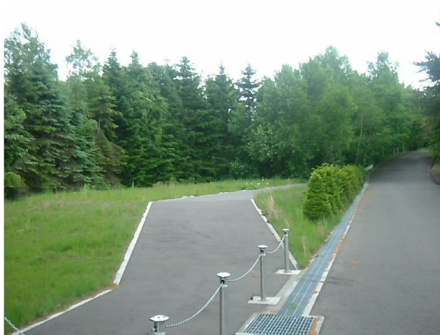
供養塚出入口（碑側）