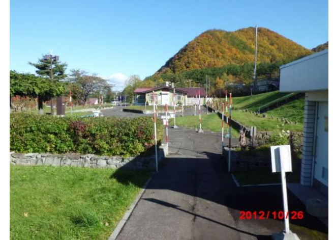
トイレ前から管理事務所方向