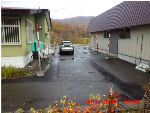
管理事務所裏手倉庫奥から進入路方向