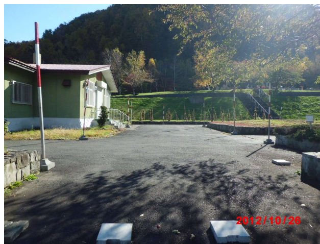
進入路突端からの管理事務所前