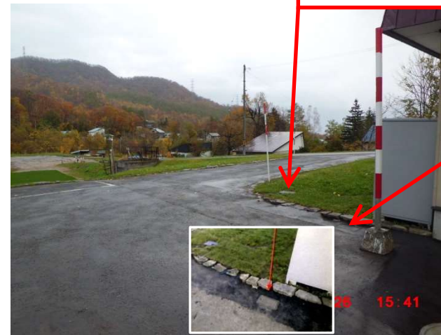
ポンプ室前から見た進入路