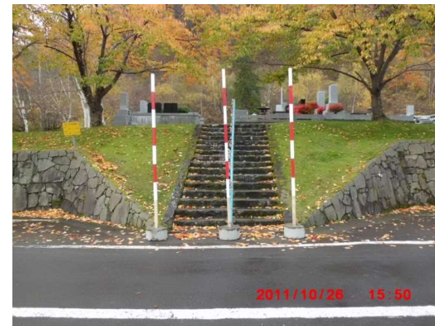
B-2号の突出している階段 (図面番号①)