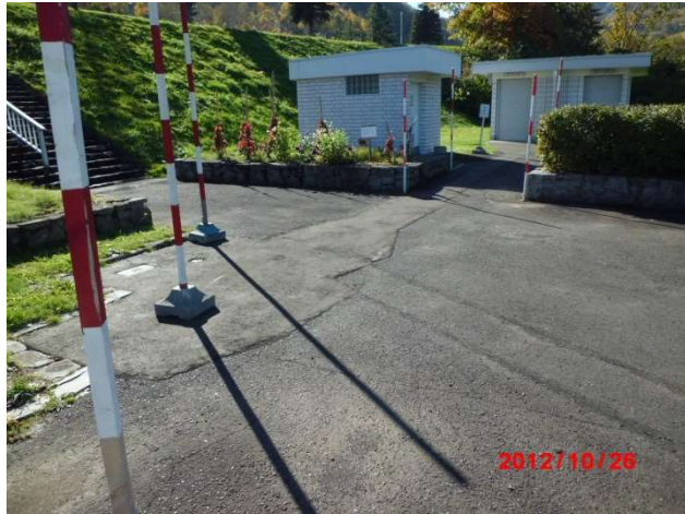
除雪通路中間地点からトイレ方向