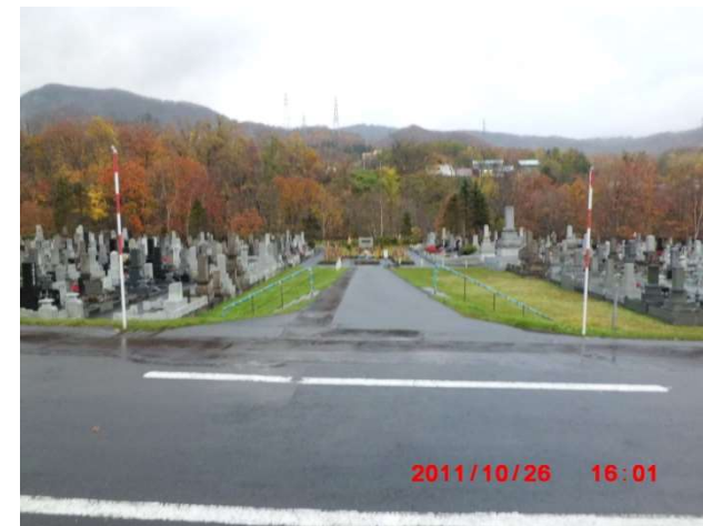
A-1号の通路確保箇所 (図面番号⑦)