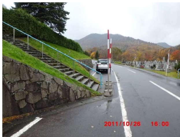
B-1号の突出している階段 (図面番号⑥)