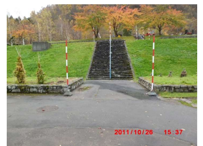
除雪指示していない階段(管理事務所側)