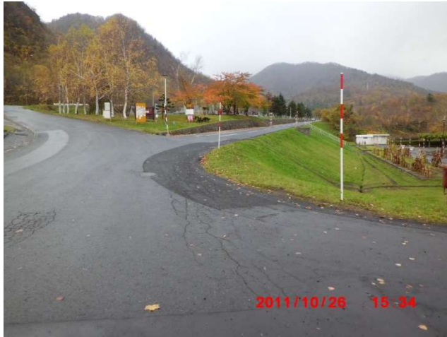
手稻平和霊園入口（右折 管理事務所方面へ）