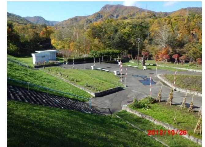
園路からの管理事務所前広場の様子