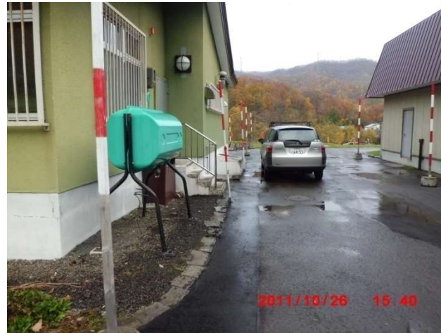
管理事務所裏の様子