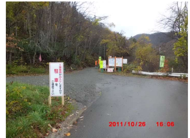
霊園最深部（市道 百松線との合流点）