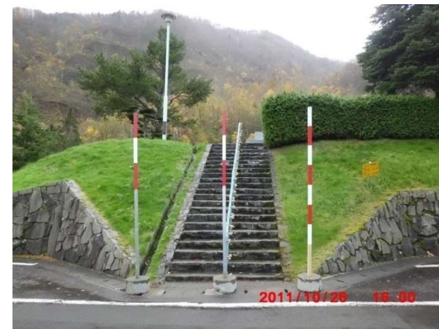
B-1号の突出している階段 (図面番号⑥)