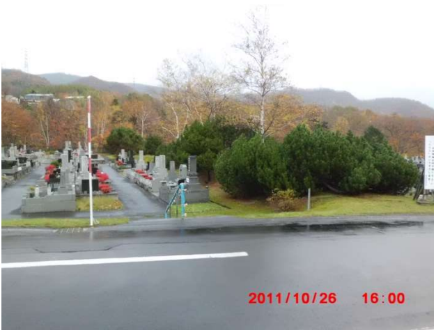
A-1号手前側 除雪指示していない階段の様子