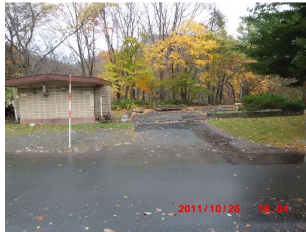
展望広場・トイレの様子