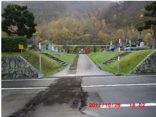
B-1号の通路確保箇所（図面番号⑧）