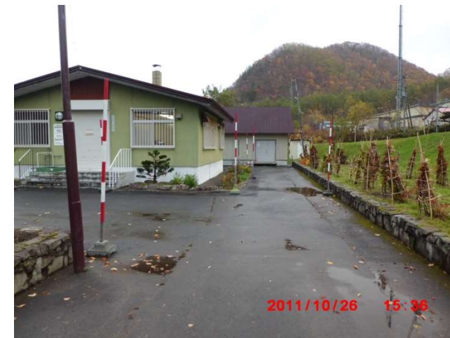
管理事務所正面右から倉庫方向