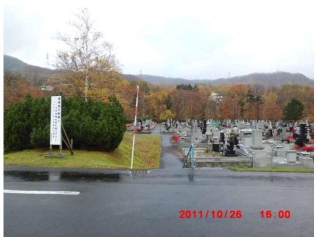
A-2号奥側 除雪指示していない階段の様子