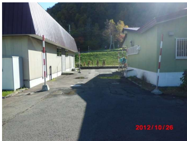
左側 ポンプ室兼倉庫、右側 管理事務所