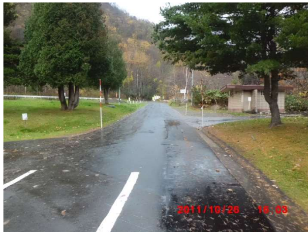
墓域最後部より霊園最深部の様子