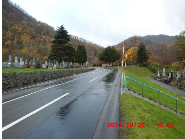
A-1号・B-1号中間点から霊園奥側の様子