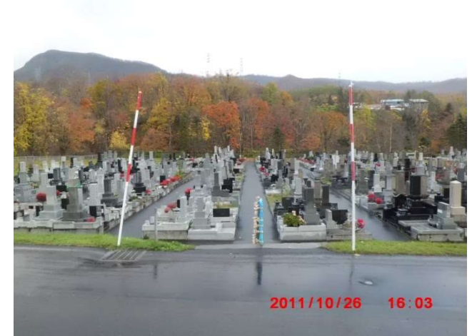
A-1号奥側 除雪指示していない階段の様子