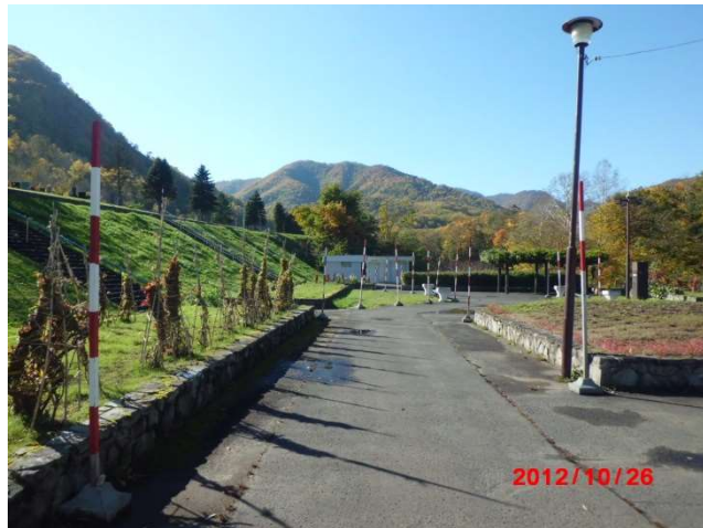
管理事務所正面右からトイレ方向