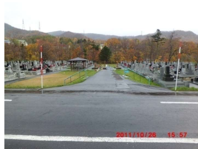
A-2号の通路確保箇所 (図面番号④)