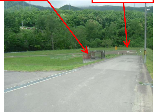
左折 管理事務所 直進 広場