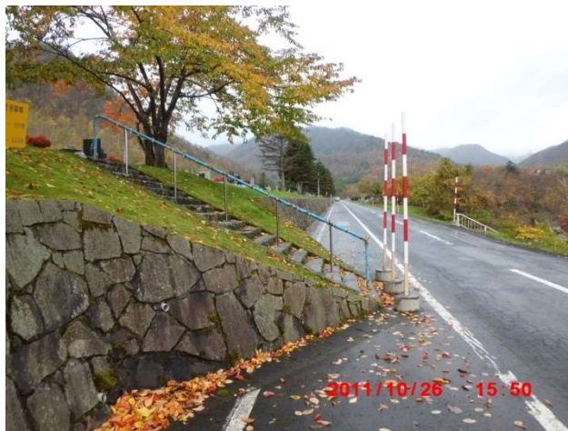
B-2号の突出している階段 (図面番号①)