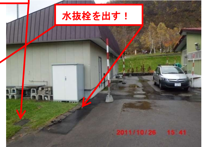
進入路から見たポンプ室兼倉庫