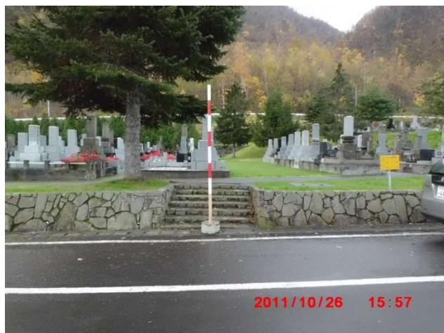
C-1号の通路確保階段 (図面番号⑤)