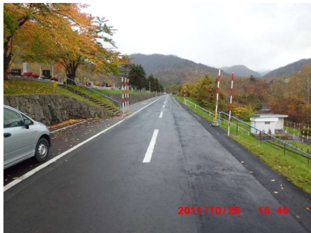
霊園入口から霊園奥の様子