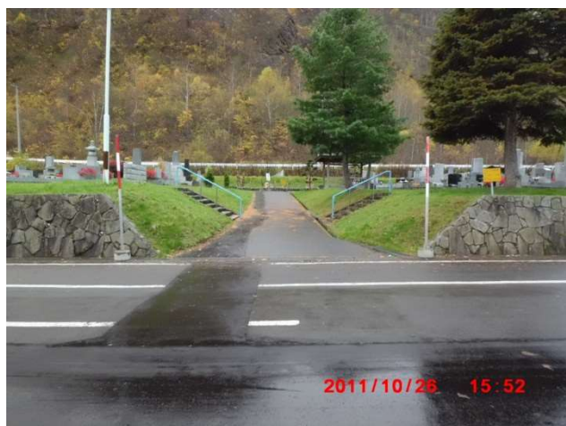
B-2号の通路確保箇所 (図面番号②)