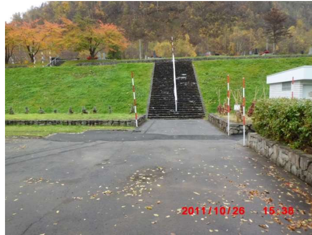
除雪指示していない階段(トイレ側)