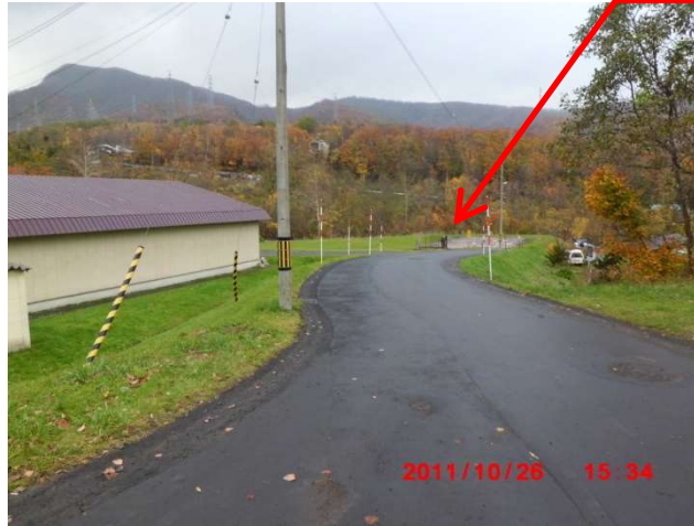
管理事務所進入路方面