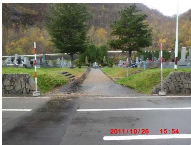
B-2号・C-1号間の通路確保箇所 (図面番号③)