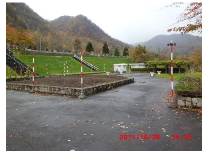
進入路突端からの管理事務所前広場