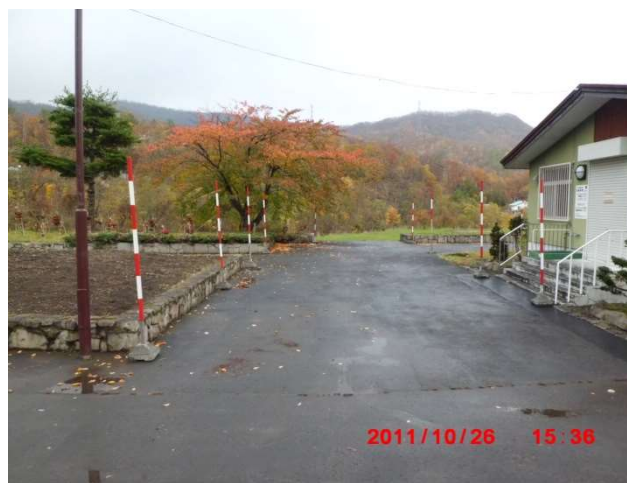
管理事務所正面右から進入路方向