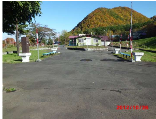
管理事務所前広場奥から管理事務所方向