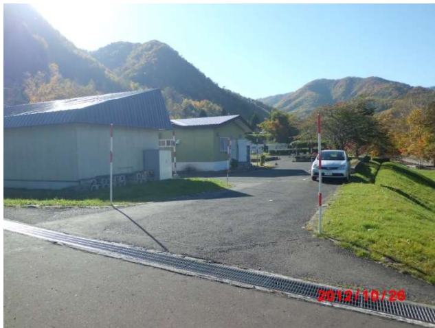
管理事務所進入路