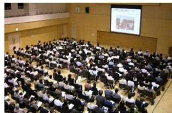
令和元年度の講習会

令和2年度は、「医療事故発生時の対応」、「医療事故防止に向けた具体的対策」のテーマで開催を予定しておりましたが、 新型コロナウイルスの影響により中止となりました。