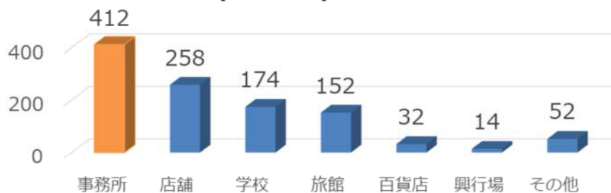
札幌市内の特定建築物(R2年度末) 計 1094施設

それでは、ビル管理法に基づく管理の対象となる特定建築物の3つの要件をまとめます。