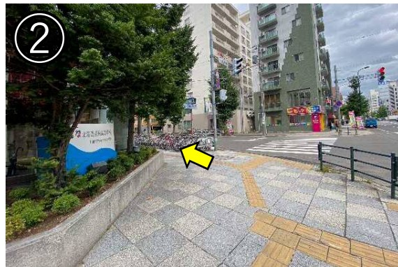
② 保健所を越えて、ひとつ目の交差点を左に曲がる (信号は渡らない)