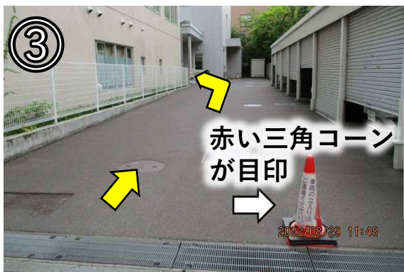
③ 右側に車庫がある通路を進み、左に曲がる