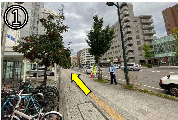
① 1番出口を出たら左へ進む (保健所正面入口には入らない)