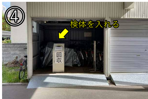
④ 裏口付近のプレハブに設置してある回収ボックスに検体を入れる