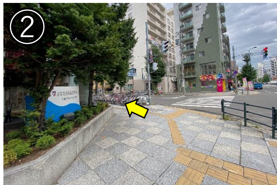
② 保健所を越えて、ひとつ目の交差点 を左に曲がる (信号は渡らない)