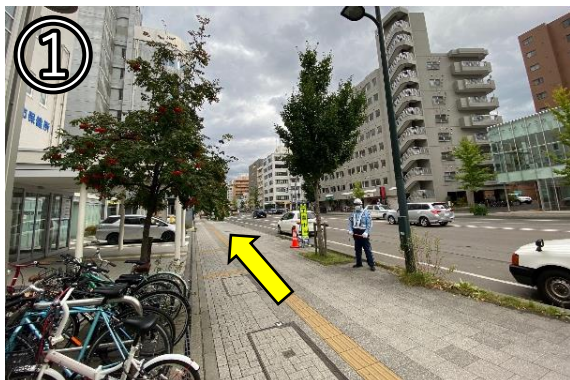
① 1番出口を出たら左へ進む (保健所正面入口には入らない)