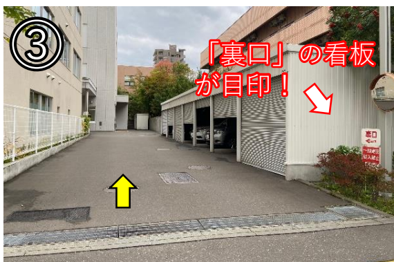
③ 右側に車庫がある通路を進む