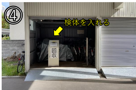
④ 裏口付近のプレハブに設置してある 回収ボックスに検体を入れる