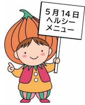
東区マスコットキャラクター 「タッピー」