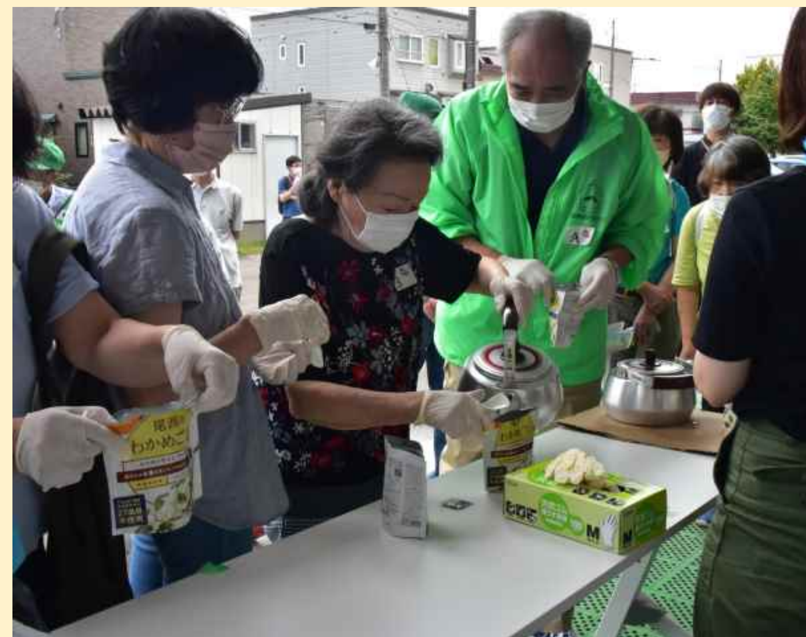
東区防災訓練(苗穂)