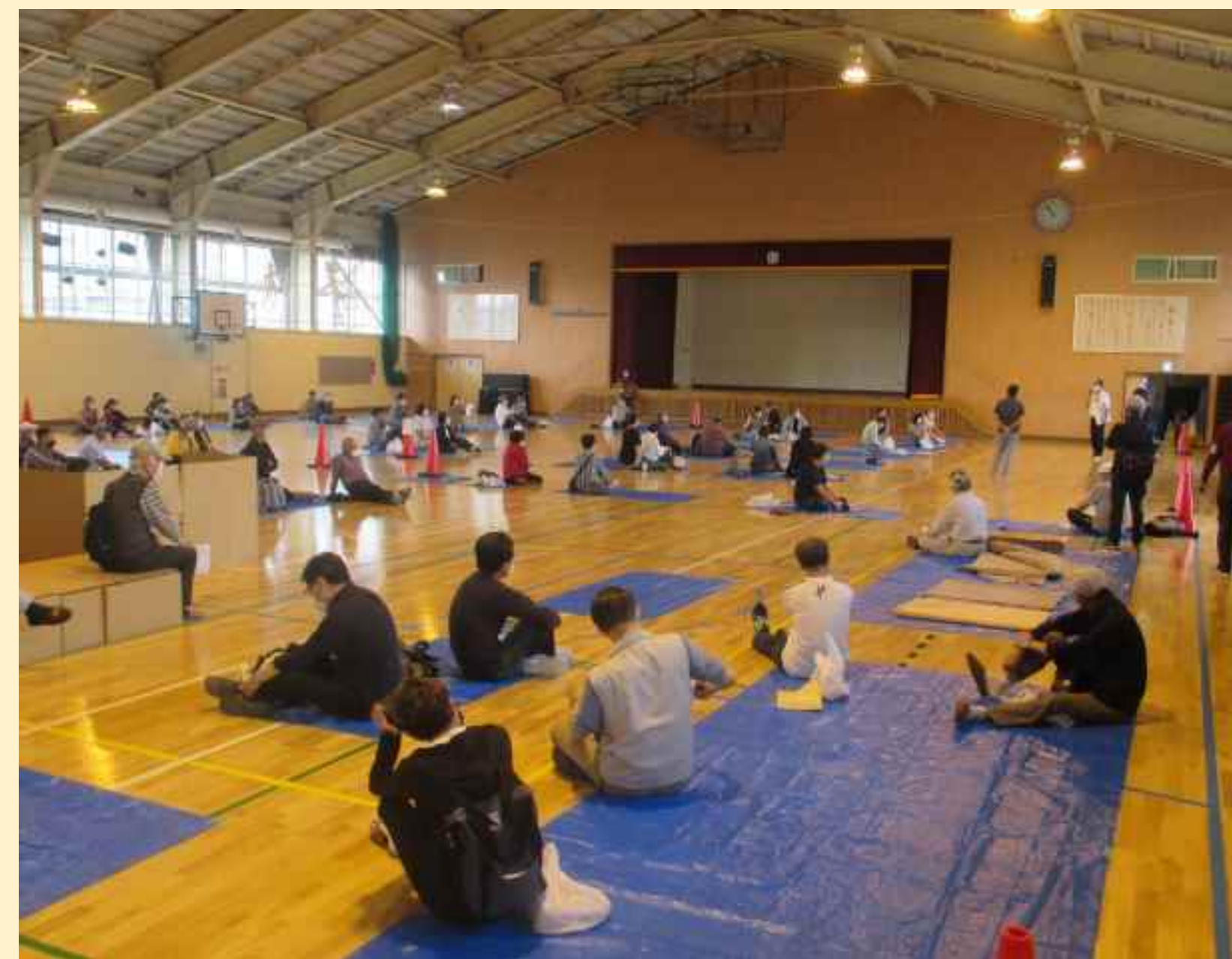
避難所開設訓練(栄東)