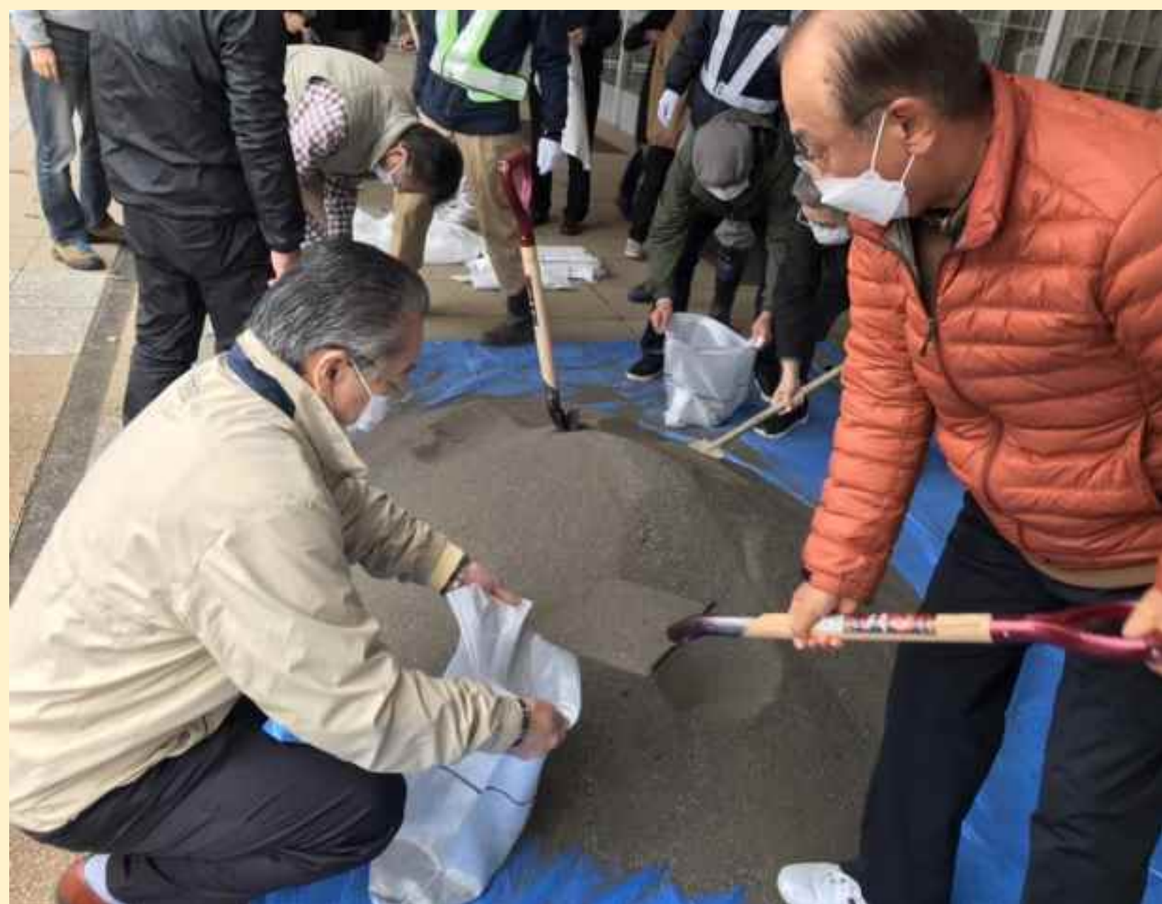
水防工法訓練(札幌)