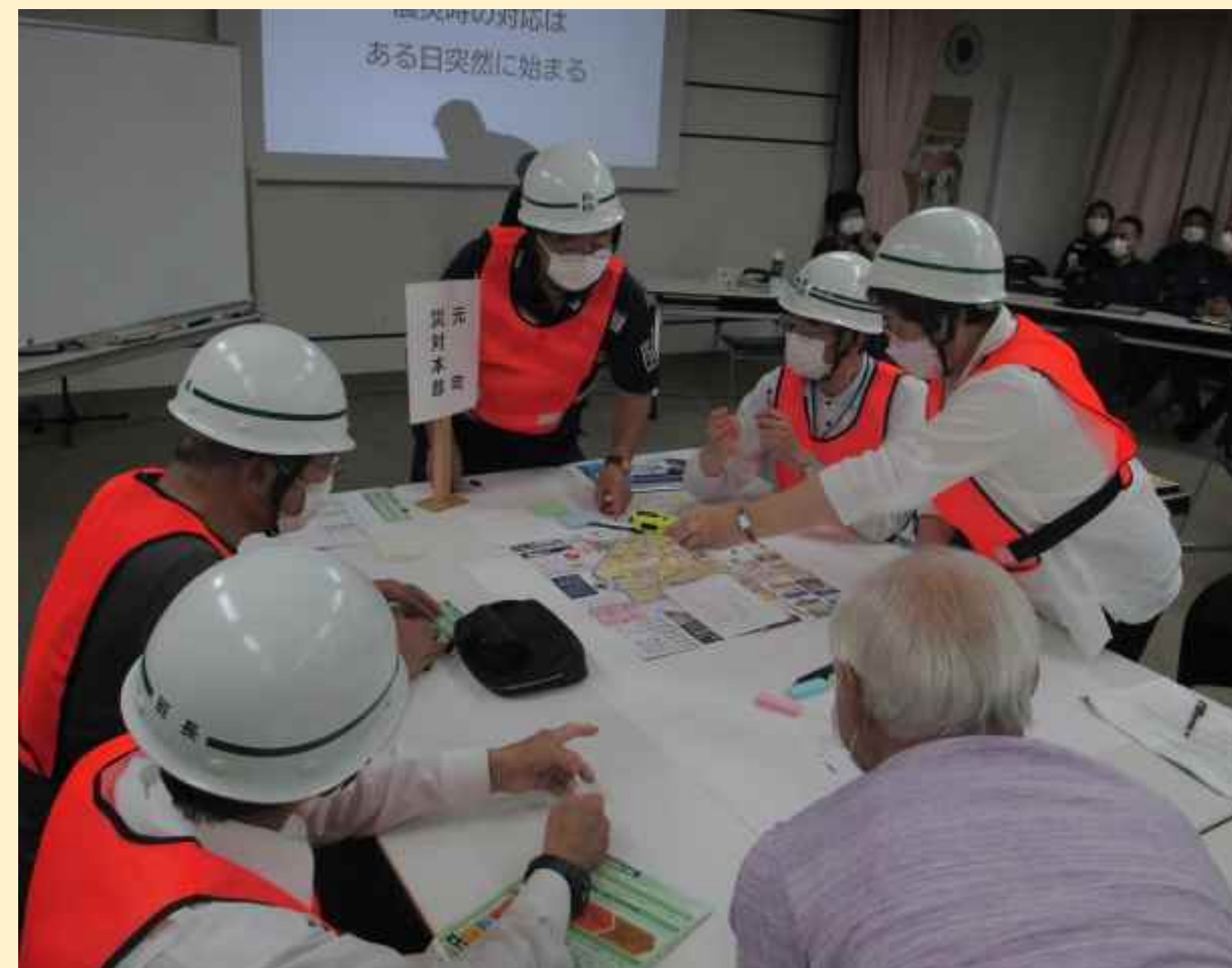
災対本部シミュレーション訓練(元町)