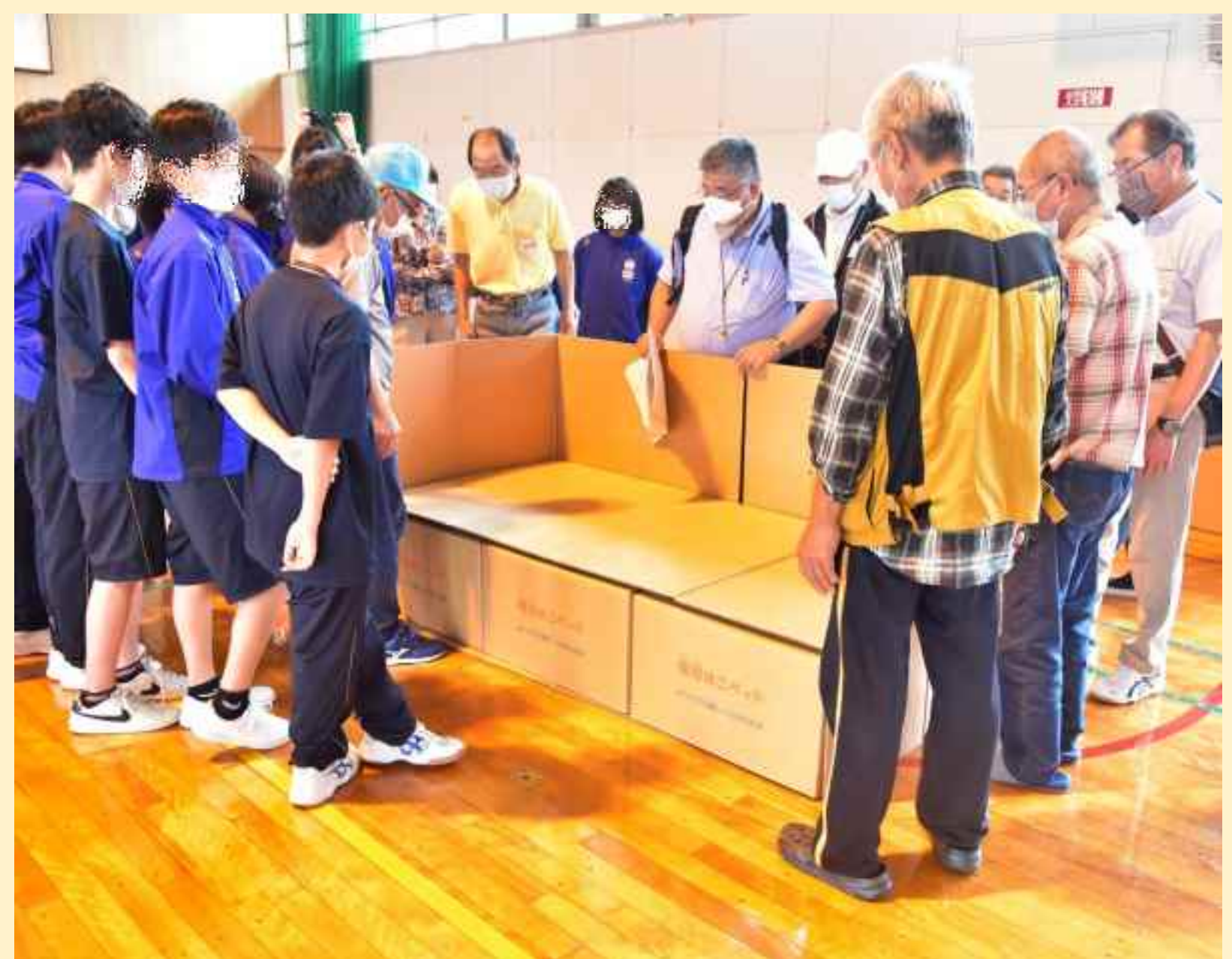
東区防災訓練(北栄)