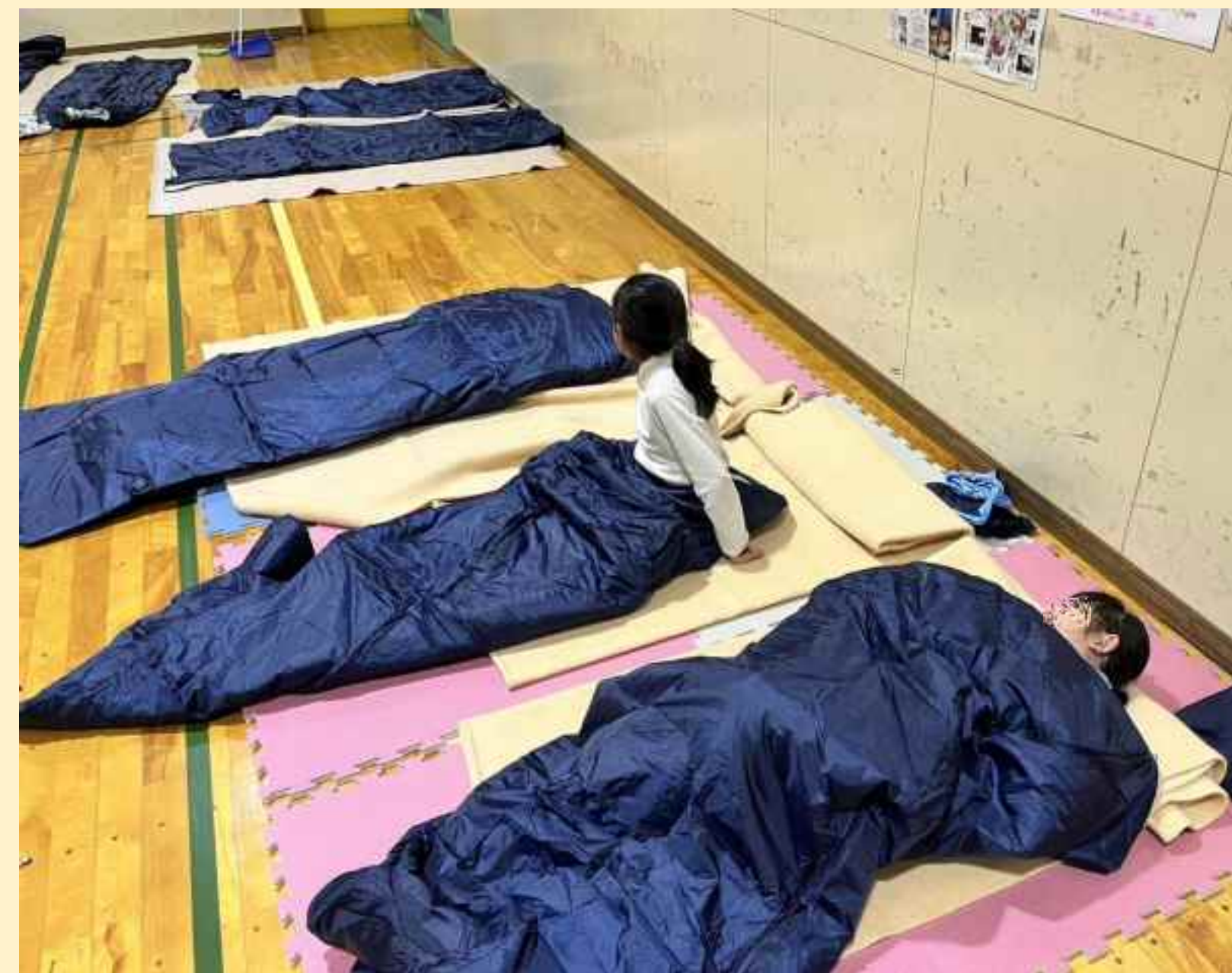
防災お泊り会(元町)