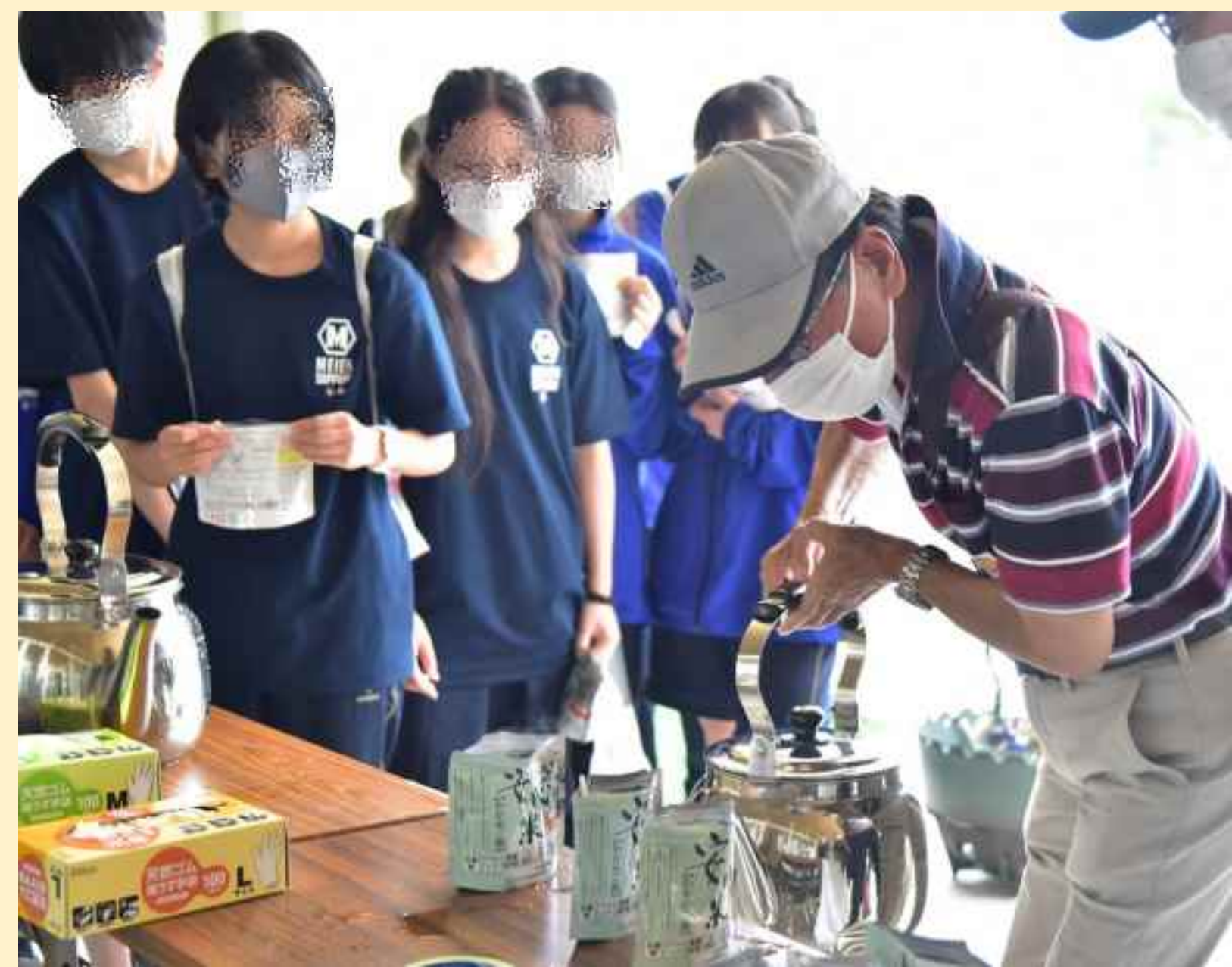
東区防災訓練(北栄)