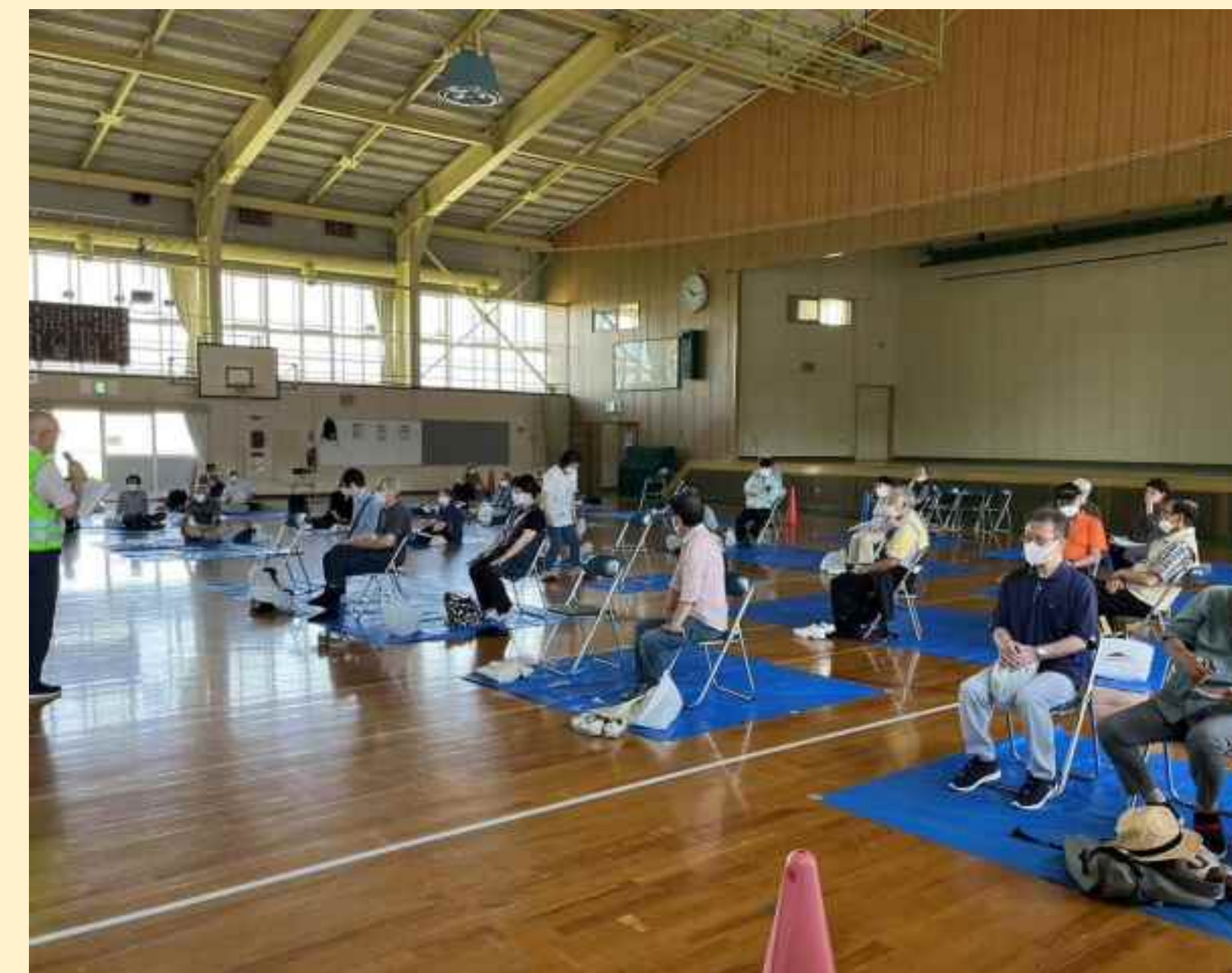
避難所開設訓練(栄東)