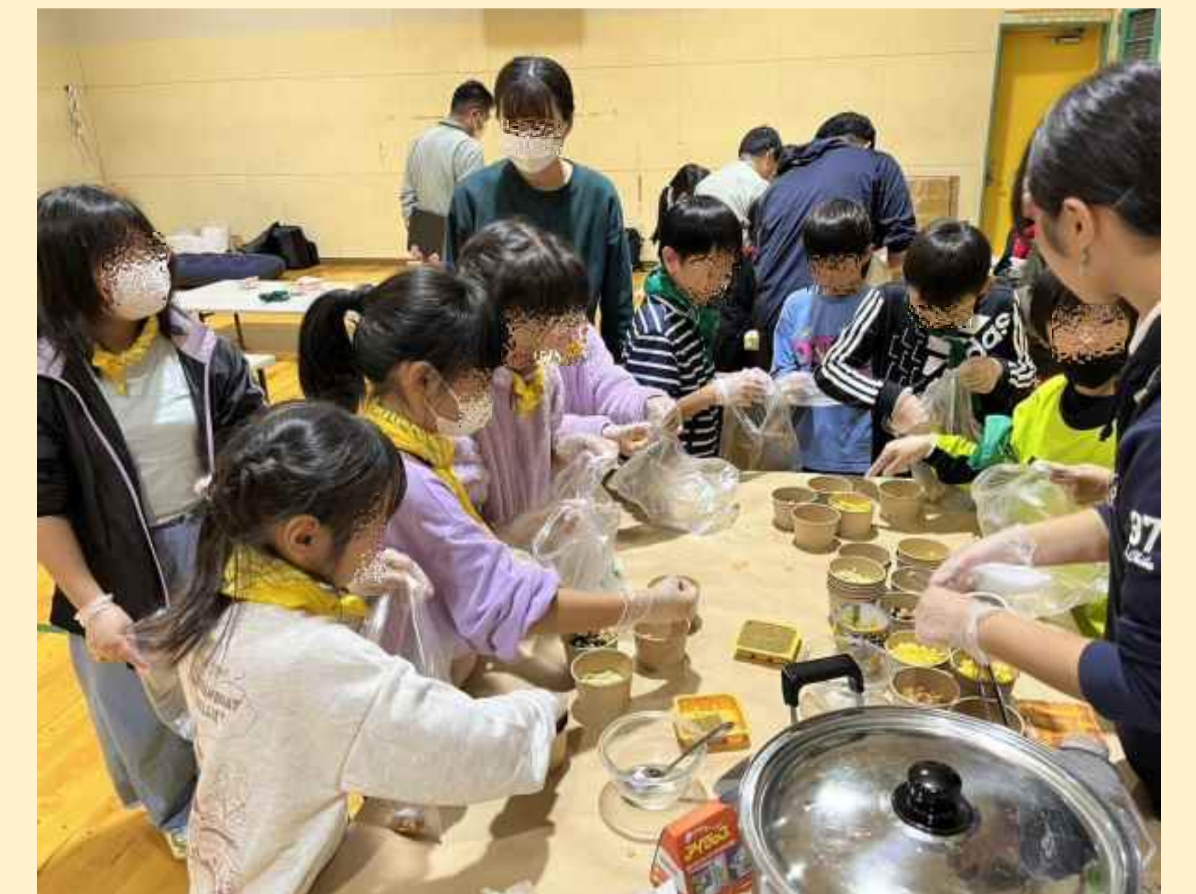
防災お泊り会(元町)