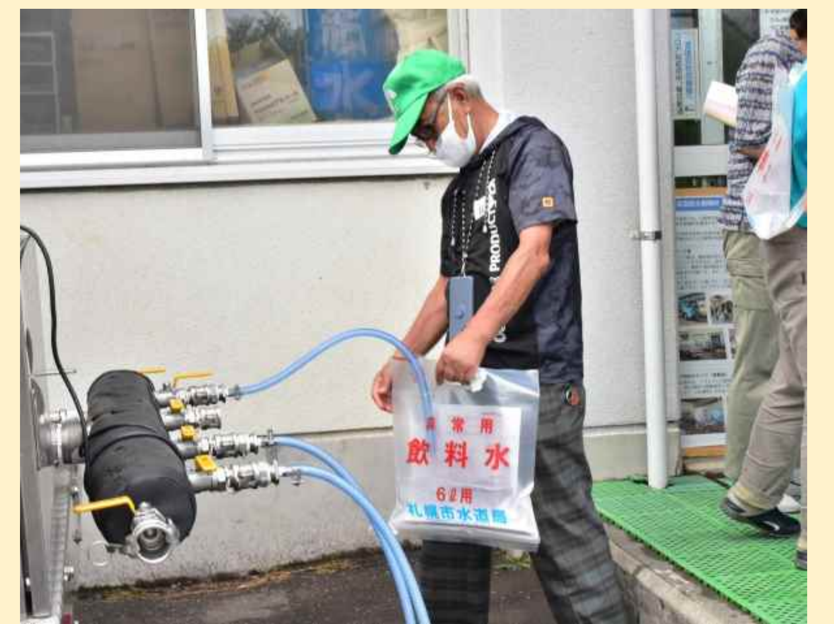
東区防災訓練(苗穂)