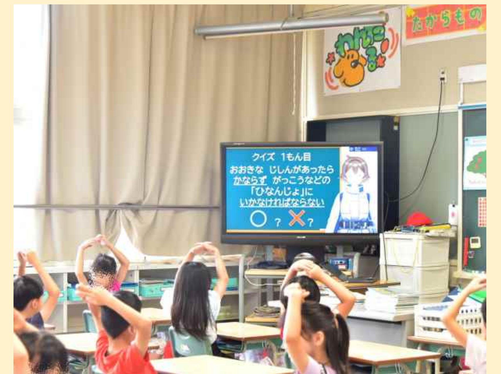
東区防災訓練 消防Vtuber防災授業