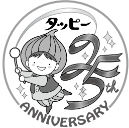
東区マスコットキャラクター「タッピー」

COME(コミュニティマーケット in 東区)とは… 東区を中心に活動している市民活動団体の情報発信と相互交流のイベントです。 展示ブースやステージパフォーマンスで活動内容を楽しく発信していきます！ ※物品の販売を目的としたイベントではありません。