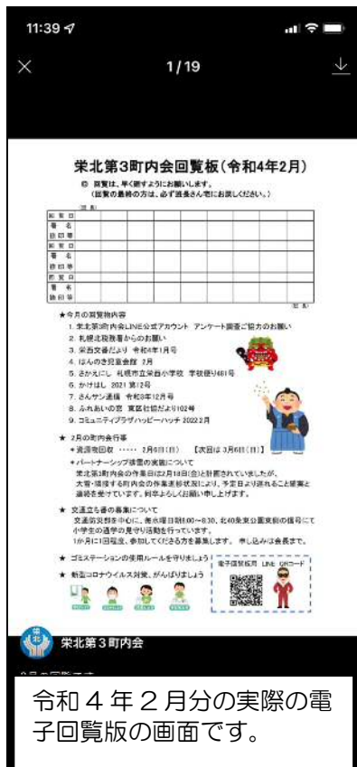
令和 4 年 2 月分の実際の電子回覧版の画面です。

また、「回覧板」の内容のみならず、地域住民の方々に有益な情報をタイムリーに発信することが可能なため、今後、さらに配信登録者を増やしたいとのことでした。