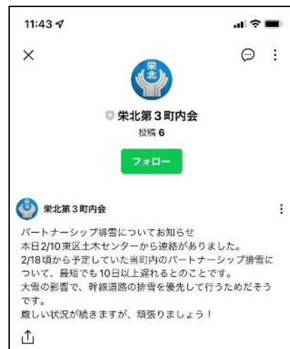
大雪により、パートナーシップ排雪が遅れるお知らせもタイムリーに情報提供できました。

札幌市によりますと、今後、市内全ての町内会に「電子回覧板導入マニュアル」を配布する計画があるとのことですので、皆様のお住まいの地区でも導入を検討してみてもいいかもしれません。