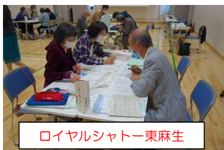
ロイヤルシャトー東麻生