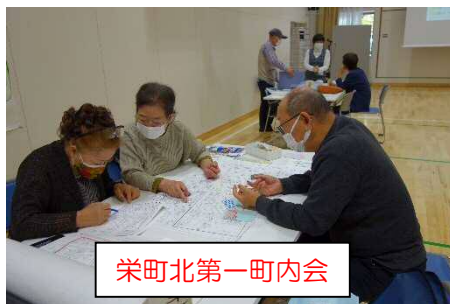
栄町北第一町内会