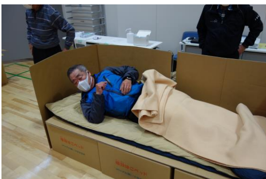
(段ボールベッドでの体験)

さらに、平成30年9月の北海道胆振東部地震を受けて、昨年2月に札幌市より各まちづくりセンターに整備された非常用自家発電機の試運転を兼ねた使用方法の確認を行いました。