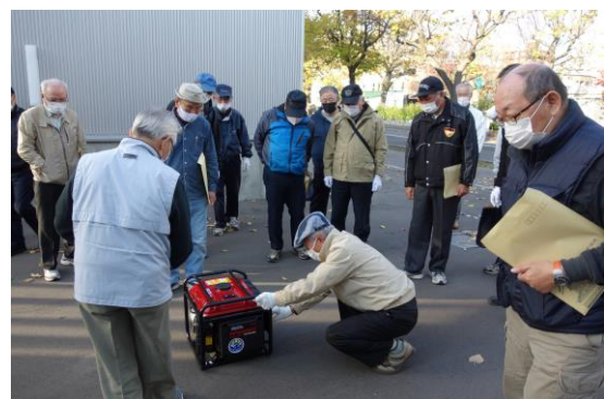
(自家発電機の試運転)

この研修会のアンケートの結果では、約97%近くの方が大変良かった、良かったと回答し、その理由として、実際に確認できて安心感が高まった、段ボールベッドが便利と感じた、テーマが時期に沿っており説明もわかりやすかった、このような研修会は忘れないよう定期的に必要、今後は地域別の避難所運営マニュアルのようなものがあればよりいい、など様々な意見がありました。