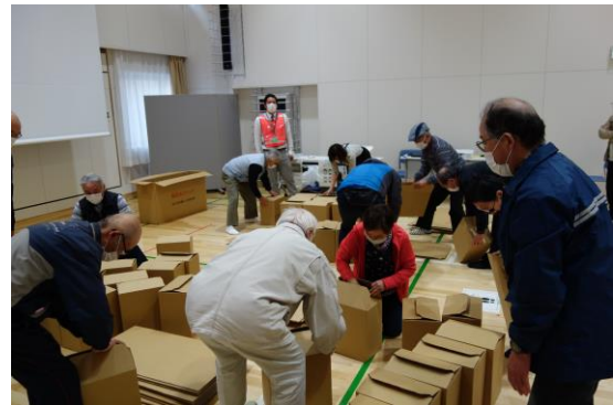
(段ボールベッドの組み立て)

その後は、実際に感染症対策を想定した避難所受付の方法、また避難所の滞在スペースの確保として段ボールベッドの作成体験を行いました。