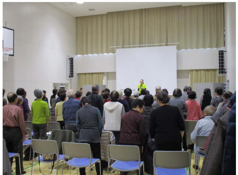
冬の健康づくり（2月28日）