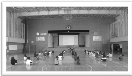
小学生を対象とした雪体験授業