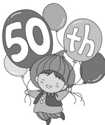
東区制 50 周年記念ロゴマーク