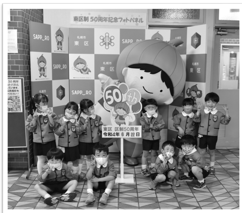
東区制 50 周年記念フォトパネル 花いっぱい事業に参加した園児たち

これからも、東区に住んで良かったと思える、安全で安心して暮らせる魅力と活力にあふれるまちの実現に向けて取り組んでまいります。