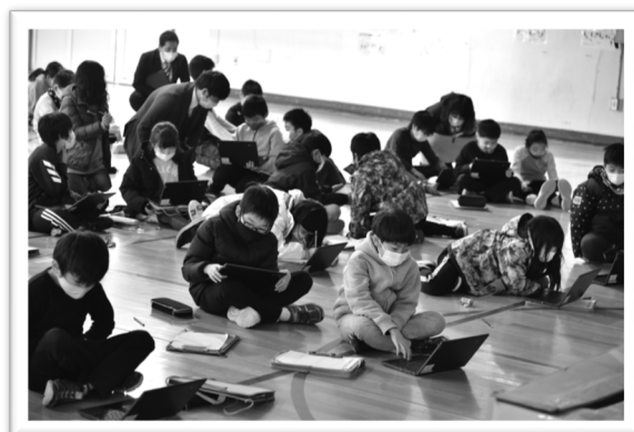
北光小学校防災授業