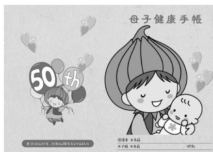
オリジナル母子健康手帳カバー