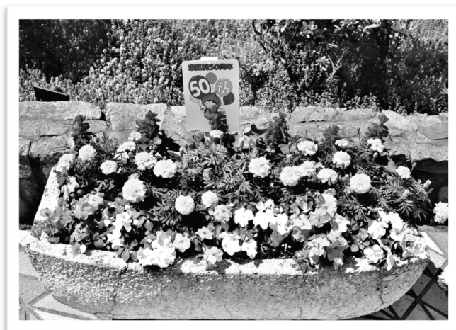
花いっぱい事業（正面玄関前のプランター）