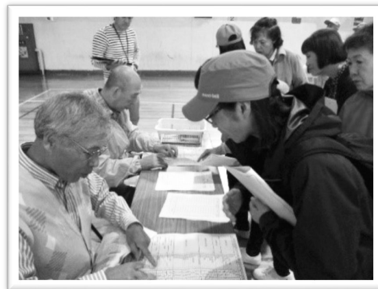
防災研修会（避難所開設・受付訓練の様子）