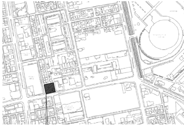
申請敷地：札幌市東区北42条東17丁目1