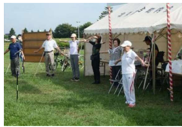
パークゴルフ大会