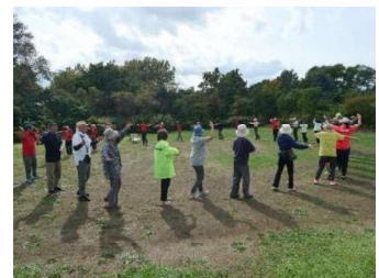
北光線を歩こうウォーキング