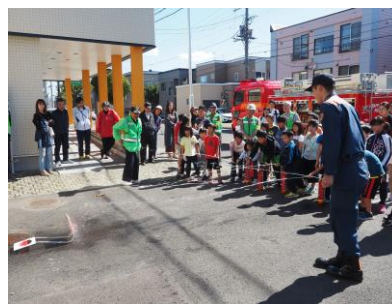
防災教室～防火訓練に 子どもたちは真剣！！