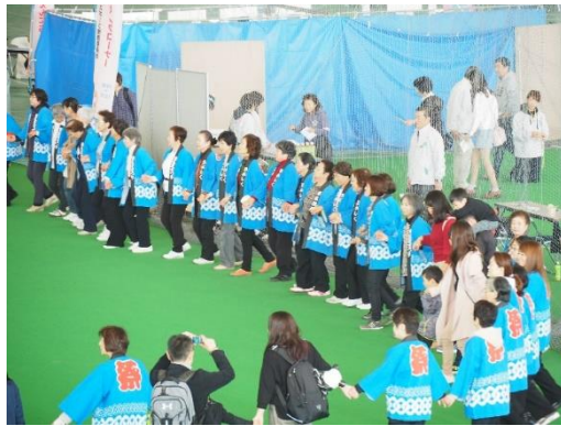
ひがしく健康スポーツまつり～東区音頭