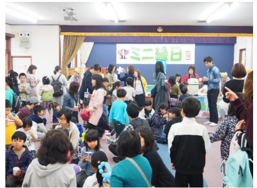
ミニ縁日～かき氷は人気 No1