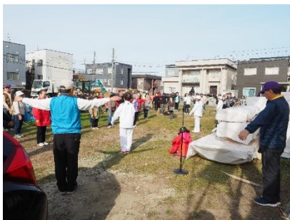
北光線を歩こうウォーキング～準備体操