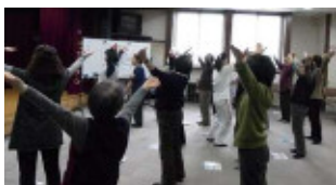
▲ラジオ体操の正しい動き方について講習会を行いました

開催日時については、下記にお問い合わせください。事前申込は特に必要なく、開催日当日、集合時間までに事務局前にお越しください。 〔問い合わせ先〕事務局：栄東まちづくりセンター内 (北41条東14丁目 ☎711-2203)