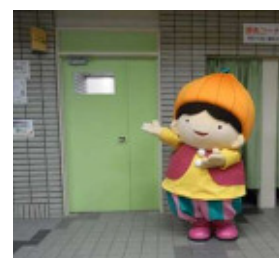
▲説明会の会場は「みどりの部屋」

の利用をお考えの方は、「こそだてインフォメーション『タッピールーム』」での説明会にご参加ください。この3事業の事前登録手続きが、まとめて出来ます。