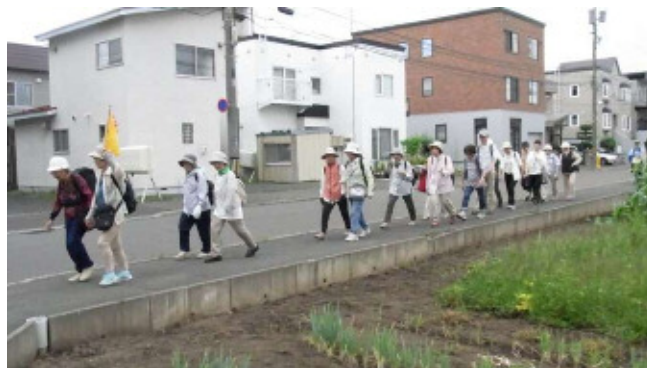
▼百合が原公園を目指して、いざ出発

例年、5月から10月まで、月に1回、ウォーキング会を実施しています。今年は、折々の花を楽しめる場所を目的地に設定しました。10月23日(火)のウォーキング会では、紅葉がきれいと言われている平岡樹芸センターを歩く予定です。