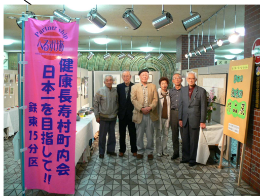
◆「趣味の会」 毎年恒例の発表会

10月の体育の日、紅葉をめでながら終了。 一日約100名が心地良い汗を流しました！！