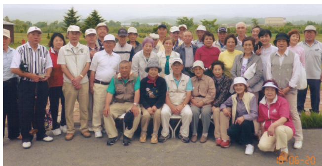
▼17分区町内会の皆さん 一泊二日パークゴルフを楽しみました！（豊浦町）

鉄東健康づくり事業のWalkは、専門の医師からのアドバイスを基に設定した、個人に合った歩数（数値）を目標として、一人ではなく近隣やお友達と一緒に取り組んでいます。その波及効果で、アマとホップのフラワーロードやYOSAKOIソーランのチームが誕生しました。