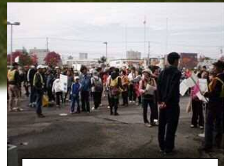
健康・スポーツまつり 2015