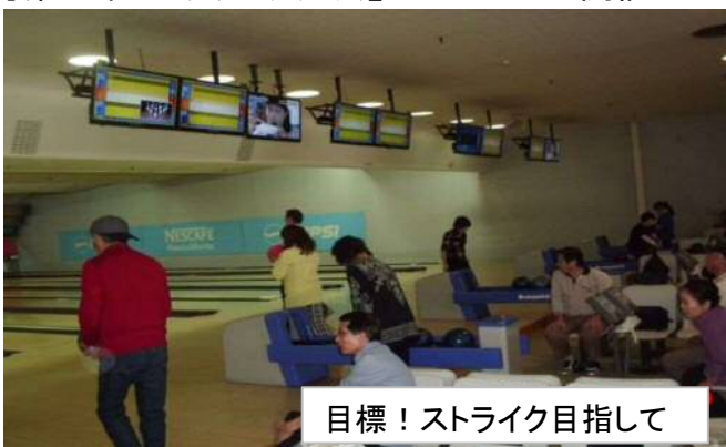
目標！ストライク目指して

※日頃の運動不足を解消するため、一投入魂！熱戦競技後は表彰式を兼ね、懇親会で慰労しました。