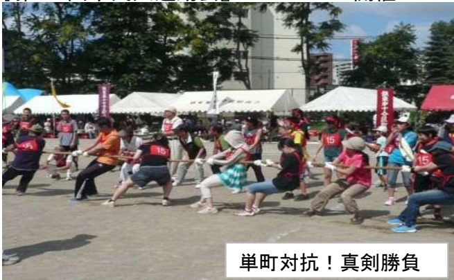
単町対抗！真剣勝負

※16の分区対抗の伝統ある運動会は約900人が参加し、健康増進と連帯意識の高揚を図りました。