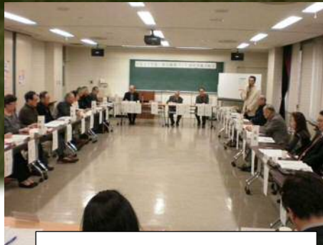
東区健康づくり連絡協議会 総会