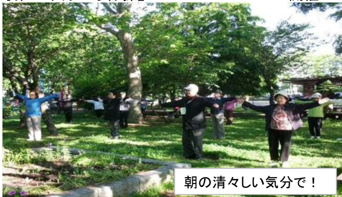
朝の清々しい気分で！

※新緑の季節 夏休み中は子供が多数参加し、元気もらいながら健康増進に努めました。