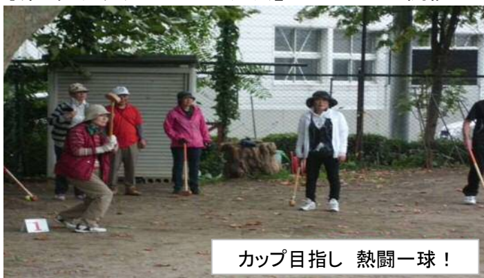
カップ目指し 熱闘一球！

※小雨降る中、雨にも負けず真剣勝負に興じました。競技後は表彰式を兼ね、焼肉を食べ懇親しました。