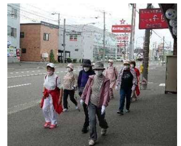
R4北光線を歩こうウォーキング