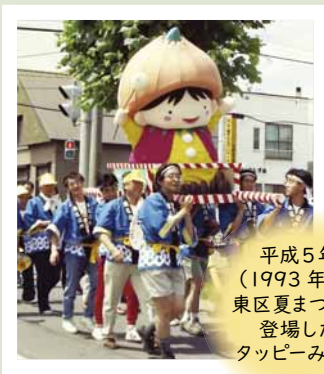
平成5年 (1993年)の 東区夏まつりに 登場した タッピーみこし

東区は、4月に区制50周年を迎えました。この節目の年に、区民の皆さんや東区に縁のある皆さんと一体となって地域をより盛り上げるため、区ではさまざまな事業を実施してまいります。