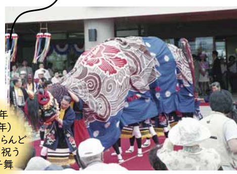
平成7年 (1995年) サッポロさとらんど オープンを祝う 丘珠獅子舞

東区は、4月に区制50周年を迎えました。この節目の年に、区民の皆さんや東区に縁のある皆さんと一体となって地域をより盛り上げるため、区ではさまざまな事業を実施してまいります。