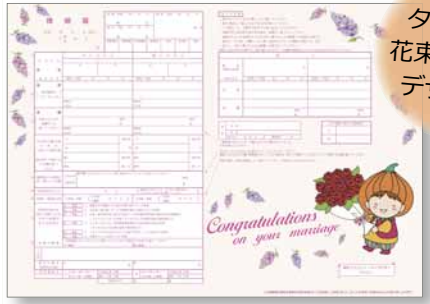
タッピーが花束を持ったデザイン♪

タッピーのイラストが入った 50 周年限定の婚姻届です。区役所の戸籍住民課で配布しており、東区のホームページから印刷することもできます。