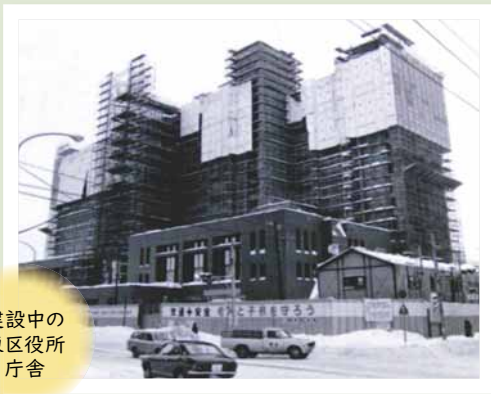
建設中の 東区役所 庁舎

新型コロナウイルスの影響で暗いニュースが多い現在ですが、東区では、区民の皆さまとともにこの節目を祝うべく、「区民が主役」をコンセプトにした各種記念事業の実施を計画しています。区民の皆さまが笑顔で明るく暮らさせて、安心安全で、住んでよかったと実感できる、魅力と活力にあふれるまちづくりを進めてまいりたいと考えておりますので、どうぞよろしくお願いたします。