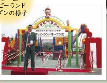
平成 6 年 (1994 年) の 伏古公園 タッピーランド オープンの様子