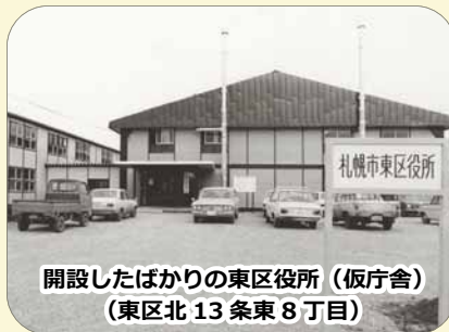
開設したばかりの東区役所（仮庁舎） （東区北 13 条東 8 丁目）

東区の昔を振り返る「東区今昔」。今月は、東区役所の昔を紹介します。東区は、札幌市が政令指定都市に移行した昭和 47 年（1972 年）4 月に誕生し、今年で 50 年を迎えました。開設したばかりの東区役所はプレハブ造りの仮庁舎で、現在の東区役所と東区民センターは、昭和 52 年（1977 年）7 月に完成しました。