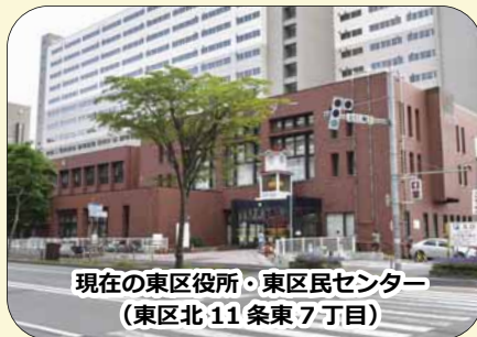
現在の東区役所・東区民センター （東区北 11 条東 7 丁目）